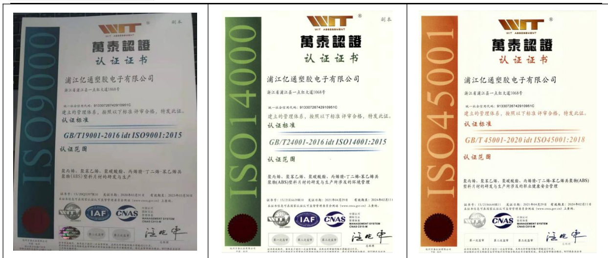
质量管理体系认证